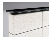
フロートキャップ